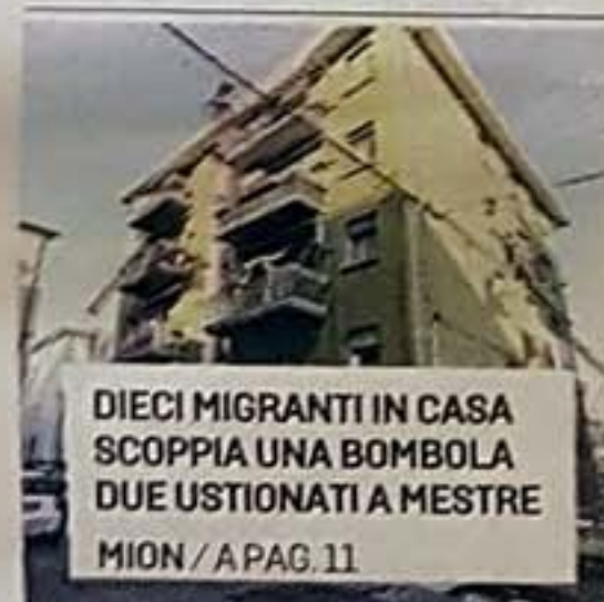
DIECI MIGRANTI IN CASA SCOPPIA UNA BOMBOLA DUE USTIONATI A MESTRE MION / A PAG. 11