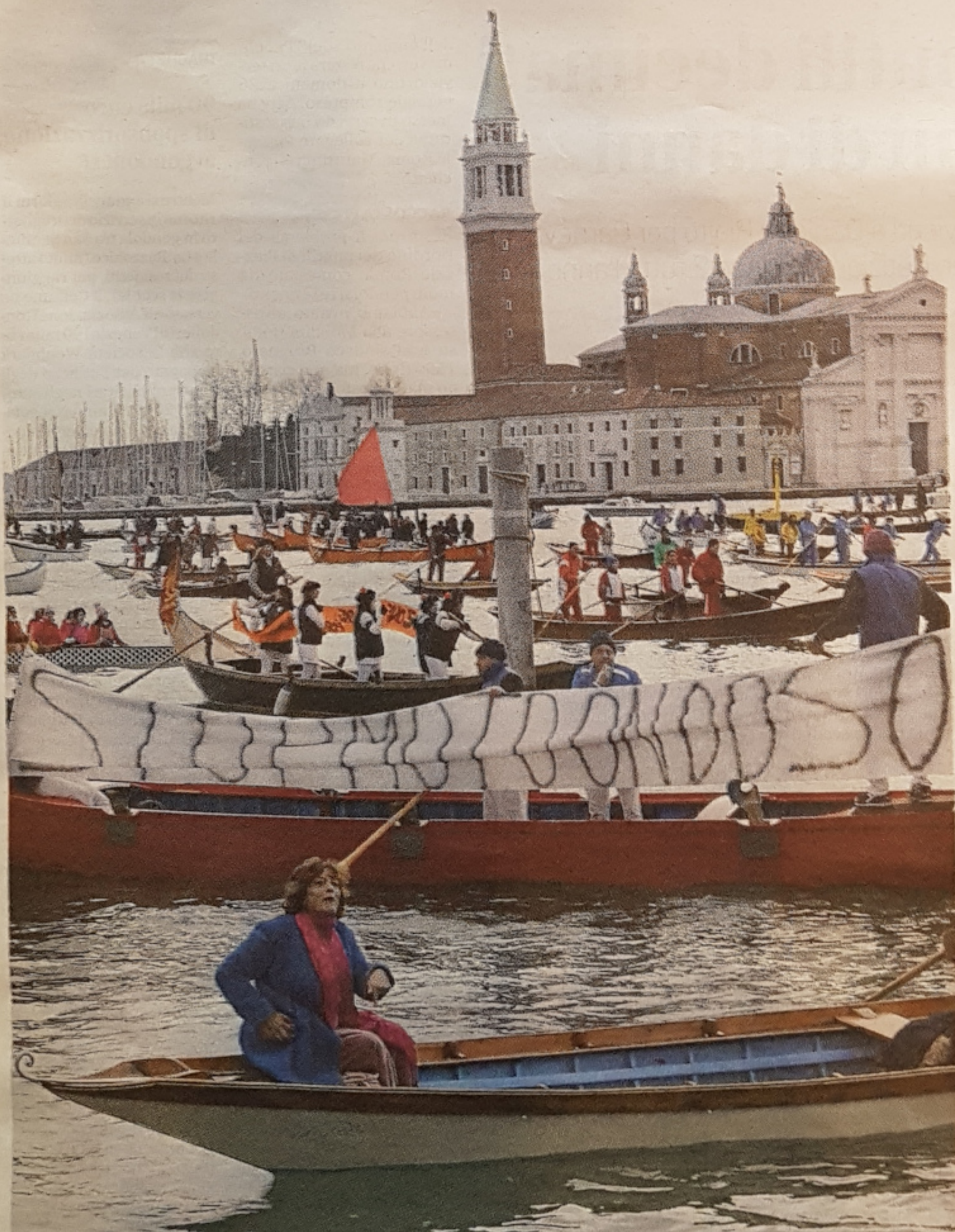
"Stop moto ondoso": lo slogan della giornata, per sensibilizzare il problema. Ma il Comune era assente