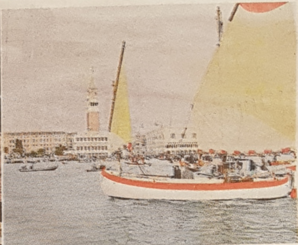
Lo sfondo del campanile e della Piazza In una giornata fredda ma bella, con le Dolomiti ben visibili, i veneziani hanno provato a riprendersi la città