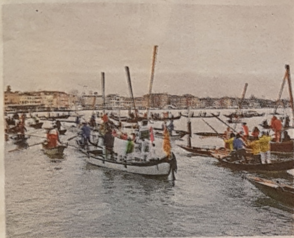
L'alzaremi in Bacino di San Marco I vogatori schierati in gran numero: centinaia di veneziani, ma anche dalla terraferma, ieri in Bacino